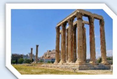
Zeus-Tempel (480 – 456 v. Chr. errichtet)