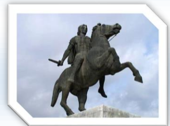
Statue – Alexander der Große